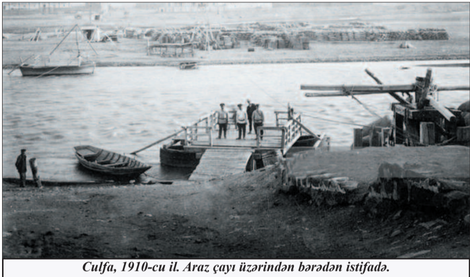
Culfa, 1910-cu il. Araz çayı üzərindən bərədən istifadə.

1831-ci il iyun ayının 3-də Rusiya Senatı tərəfindən qəbul edilmiş “Cənubi Qafqaz ölkəsində ticarət və gömrük işlərinin təşkili haqqında” Əsasnaməyə uyğun olaraq Azərbaycan ərazisində gömrük sahələri, o cümlədən Naxçıvan gömrük sahəsi yaradılmış, Xarici Ticarət Departamentinin 1 sentyabr 1831-ci il tarixli əmri ilə Azərbaycan ərazisində fəaliyyət göstərən gömrük orqanları Qafqazqaziya Gömrük Dairəsinə tabe etdirilmişdir. Qafqaz canişini Aleksandr Baryatinski tərəfindən 31 mart 1861-ci ildə təsdiq